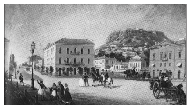
Η Πλατεία Συντάγματος γύρω στο 1890.

Για να τιμήσει η Αμαλία την κυρία της αυλής, γίνανε οι γάμοι τους με μεγάλη μεγαλοπρέπεια μέσα στο παλάτι. Παραβρέθηκαν οι βασιλιάδες με όλους τους παλατιανούς. Κομπάρσος, ο τότε πρωθυπουργός Θανάσης Μιαούλης. Η βασίλισσα, κατά τα γραφόμενα εφημερίδας της εποχής « εδώρησεν εις την Πηνελόπην δύο κιβώτια περιεκτικά πλήρους συλλογής τραπεζικών σκευών και εν βραχιόλιον υπερβαλ-