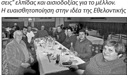
Οι αιμοδότες μας.

Η ευαισθητοποίηση στην ιδέα της Εθελοντικής