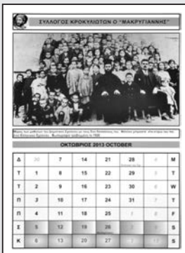
Δείγμα από το εσωτερικό του ημερολογίου.

ημερολόγια. Δυστυχώς πουλάμε μόνο εκατό με εκατόν πενήντα ημερολόγια. Αν μπορούσαμε να πουλήσουμε τριακόσια η τιμή θα ήταν στο μισό. Πρέπει όλοι ν' αγοράσουμε. Θα υπάρχει στη Γενική Συνέλευση και στο γλέντι τις απόκριες στο χωριό. Επίσης για να το προμηθευτείτε νωρίτερα μπορείτε να τηλεφωνήσετε στα μέλη του Δ.Σ. για να βρεθεί ένας τρόπος παραλαβής. Η τιμή των ημερολογίων φέτος είναι χαμηλότερη και κλιμακωτή ανάλογα με τον αριθμό των ημερολογίων που αγοράζονται. Το ένα κοστίζει 8 €, τα δύο 15 €, τα τρία 20 € και τα τέσσερα 25 €.