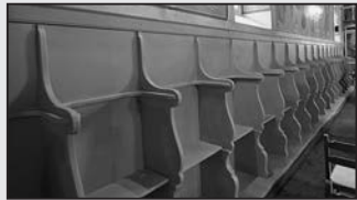
Τα καινούργια στασιδία

σκευά να βοηθήσουν στην ανακαίνιση της εκκλησίας μας, καθώς και των εξωκλισιών.