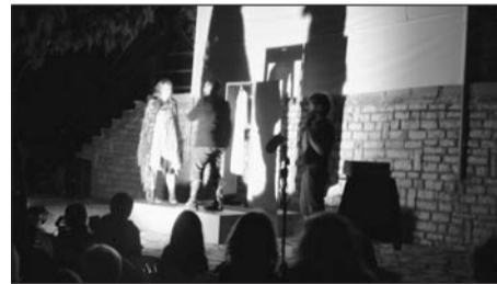
Η θεατρική παράσταση στο «Λιβάδι».