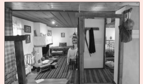
Το χειμωνιάτικο στο πάνω πάτωμα.