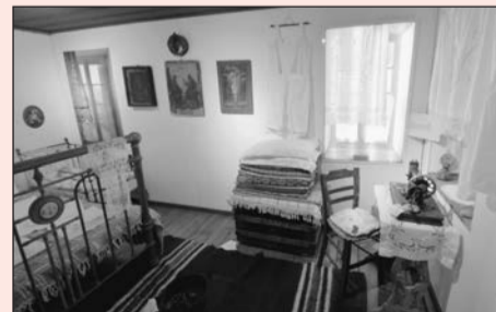
Η σάλα, το καλό δωμάτιο, στον πάνω όροφο.