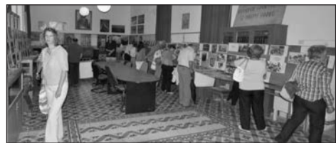
Το άνοιγμα της έκθεσης φωτογραφίας &amp; ζωγραφικής.

Ήταν τιμή για μένα που παραβρέθηκα στα εγκαίνια του Λαογραφικού Μουσείου του χωριού και μου δόθηκε η ευκαιρία να συμμετέχω κι εγώ με έκθεση