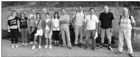
Οι ορειβάτες στην αφετηρία στη Μεγάλη Βρύση.

Στις 11 Αυγούστου στις επτά το πρωί έγινε η σύναξη των μυστών της ορειβατικής στη Μεγάλη Βρύση. Από εκεί ξεκίνησε η ετήσια πορεία για Παναγία -