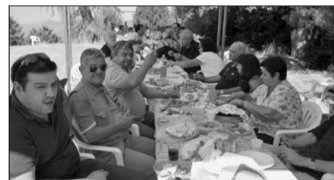
Οι πανηγυριστές τρώνε και στέλνουν κέρασματα ο ένας στον άλλον.

Στην Αθήνα έδωσε αίμα και ο Κωνσταντίνος Σαΐτης. Εκτός από τις ευχαριστίες του Συλλόγου νομίζουμε πως πρέπει να συγχαρούμε τους χωριανούς μας για την ύψιστη σημασία της πράξης τους. Πρέπει ακόμα