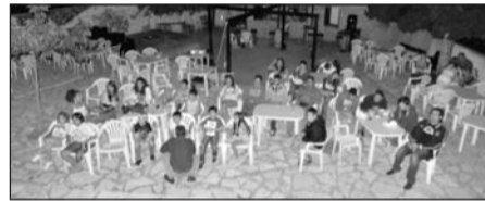
Στη κινηματογραφική οθόνη «βρέχει κεφτέδες».

Αρχή καλοκαιριού. Το Διοικητικό Συμβούλιο συνεδριάζει. Η ερώτηση: «Φέτος έχουμε Μακρυγιάννεια»; Η απάντηση είναι ότι σύμφωνα με απόφαση της Γενικής Συνέλευσης τα Μακρυγιάννεια γίνονται κάθε δύο χρόνια. Επομένως φέτος έχουμε ησυχία. «Ναι αλλά πρέπει να γίνουν εκδηλώσεις αφού κάνουμε κάθε χρόνο». Όλοι συμφώνησαν ότι ο Σύλλογος δεν μπορεί να παραμείνει αργός. «Και τι εκδηλώσεις να κάνουμε φέτος;», ρωτάει άλλο μέλος. Ο πρόεδρος υπενθυμίζει τον τρόπο δράσης του Συλλόγου. Εκδη-