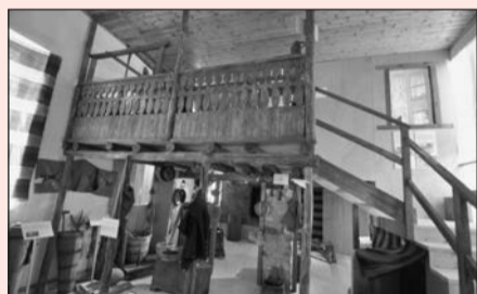
Η θέα μπαίνοντας στη μικρή αίθουσα του σχολείου.

Φέτος το καλοκαίρι εγκαινιάσαμε και το Λαογραφικό μας Μουσείο στο Σχολείο. Ήταν μεγάλη στιγμή για το Σύλλογο. Ήταν η εκπλήρωση προσδοκιών πολλών χρόνων. Εδώ πρέπει να