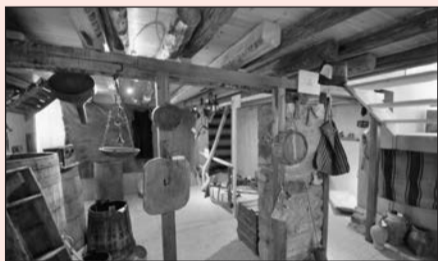
Το υπόγειο του ομοιώματος του σπιτιού.