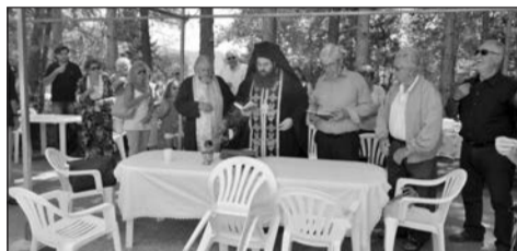
Ο Αγιασμός των εγκαίνιων.

Την ίδια μέρα είχε προγραμματιστεί καλοκαιρινή συνέντευξη στο σχολείο που ακυρώθηκε λόγω έλλειψης απαρτίας αλλά και βροχής. Το θέμα της μεταφοράς έδρας, που ήταν το θέμα της συνέλευσης, θα τεθεί