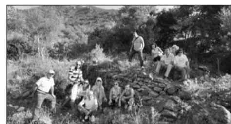
Επίσκεψη στα χαλάσματα του πατρικού Μακρυγιάννη.