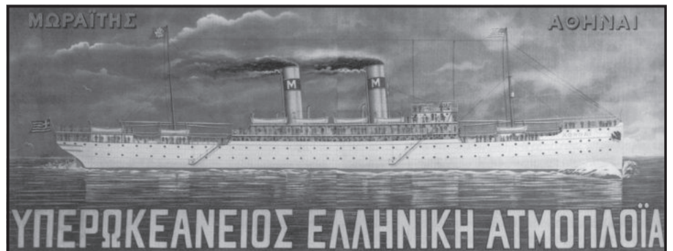
Εικ. 2: Το υπερωκεάνιο «Μωραϊτής»

Τώρα να πάμε λίγο πίσω. Στο μυαλό μας σχηματίζεται το ερώτημα πως άρχιζε ένα τέτοιο ταξίδι από ανθρώπους απομονωμένους στα βουνά, χωρίς πληροφόρηση. Κατ' αρχήν η τοπική παράδοση λέει ότι πρώτοι πήγαν στην Αμερική οι Αλποχωρίτες οι οποίοι με γράμματά τους αποθάρρυναν τους συμπατριώτες τους ν' ακολουθήσουν. Μετά από δύο τρία