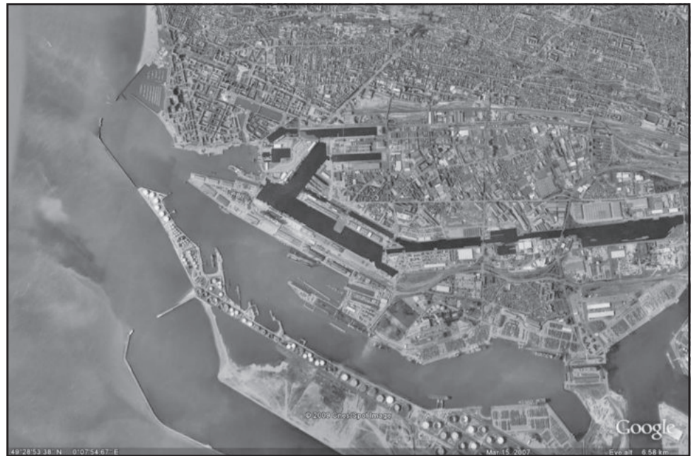
Εικ. 3: Το λιμάνι της Χάβρης.