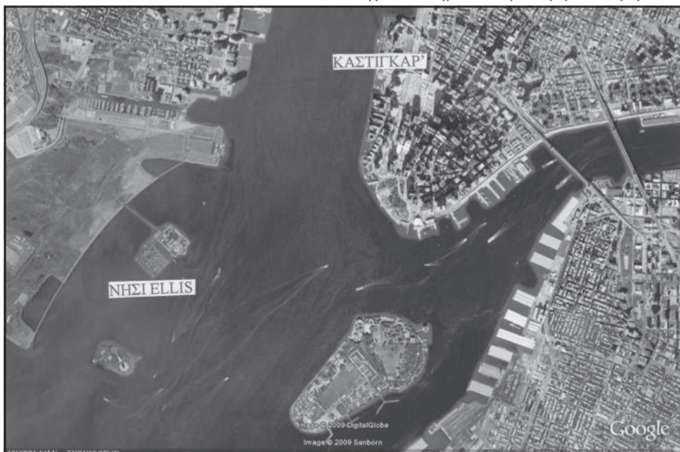
Εικ. 5: Το λιμάνι της Νέας Υόρκης με το νησί ELLIS και το Καστιγκάρ'.

φέρει ως ενδιάμεσο προορισμό τη Νάπολη. Από τον Ιούνιο του 1907 η Ελλάδα