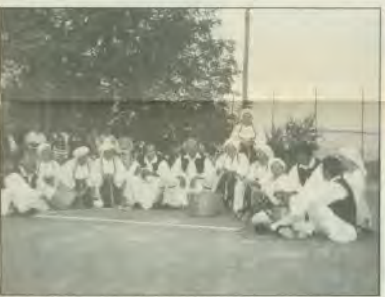
Τα ξεμπουλταίατα (από τα δρόμενα του χορευτικού).