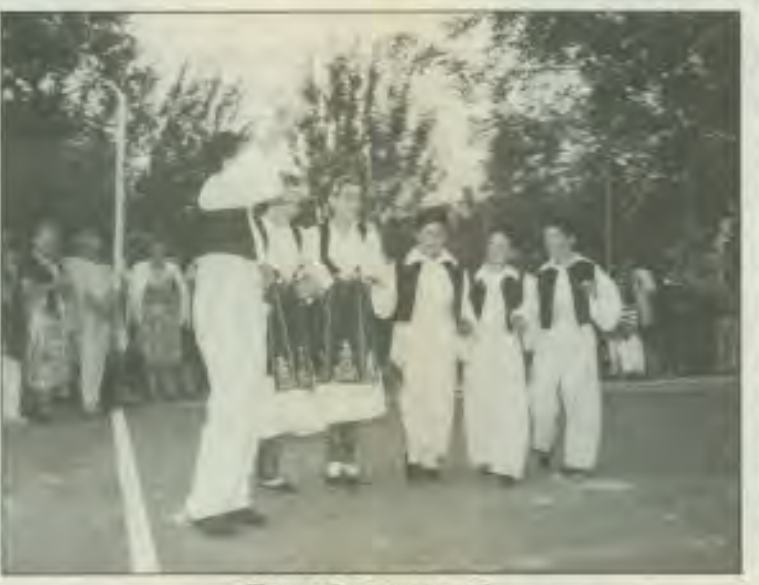
Το μικρό μας χορευτικό.