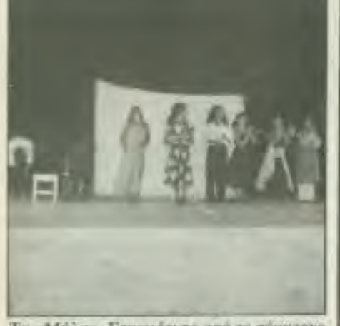
Τα «Μήλα». Στιγμιότυπο από το σύγχρονο χορό τους και τα δρώμενα.