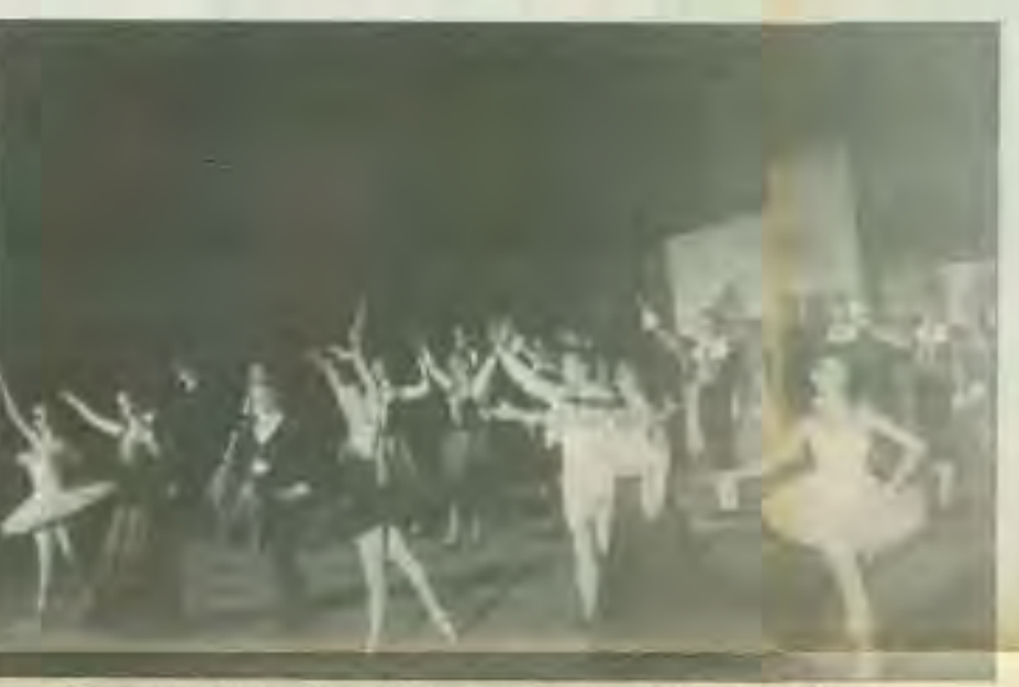
Τα μπαλέτα Μπολσόϊ της Μόσχας χορεύουν στο ρζοβραχο Δον Κιχύτη.