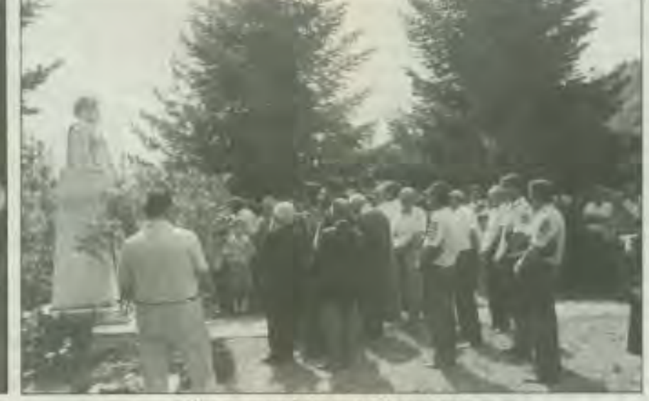
Τρισάγιο στην προτομή Μακρυγιάννη,