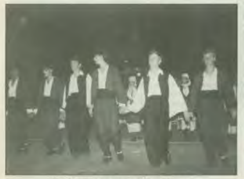
Τα παληκάρια του μεγάλου Χορευτικου μας.