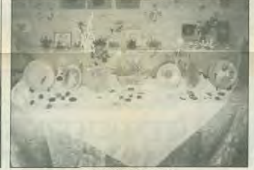
Τα παιδιά μας δημιουργούν