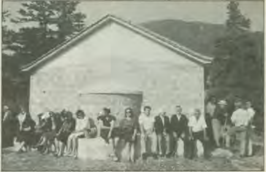
Κροκυλιότες και Πενταγιώτες στη Θεοτόκο την 23/8/91

Όπως πέρισυ, και παλαιότερα, οι Κροκυλιώτες και οι Πενταγιώτες γιόρτασαν μαζί στις 23 Αυγούστου στη Θεοτόκο. Αντάμωσαν φίλοι παλησί και συγγεveiς, αντάλλαξαν εγκάρδιες ευχές και τα είπαν,