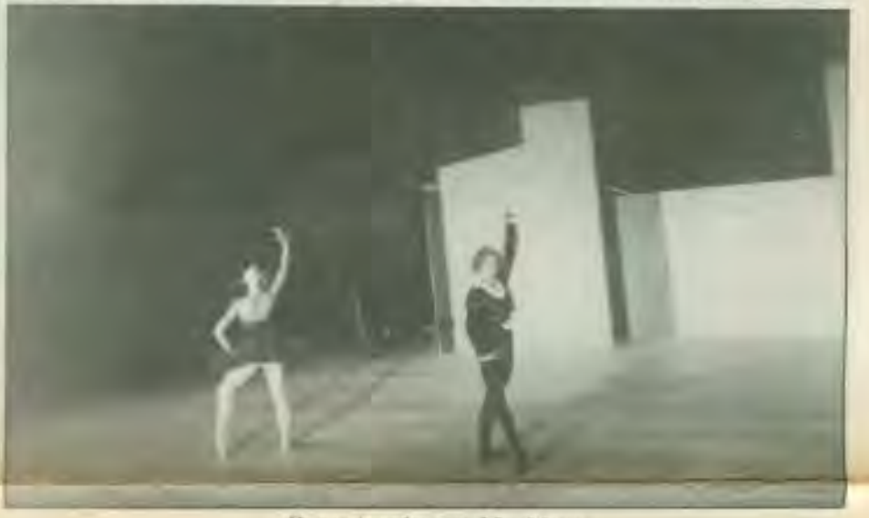
Οι κροφυραίοι τουν Μπαλέτουν.

Η μόνιμη σκηνή με την προσθήκη της στο ρξόδραχο με φόντο το μαγκυτικό τοπίο.