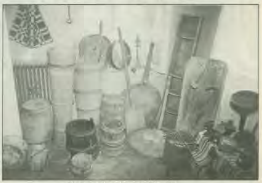
Εικόνα απ' το Μουσείο Κροκυλίου