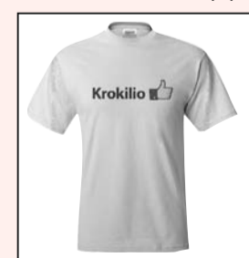
Νέα t-shirt κάνουν like στο χωριό

μαρμελάδες, πλεκτά, ξυλόγλυπτα, T-shirts, κοσμήματα, τσάντες, ζώνες και πολλές ακόμα χειροποίητες δημιουργίες