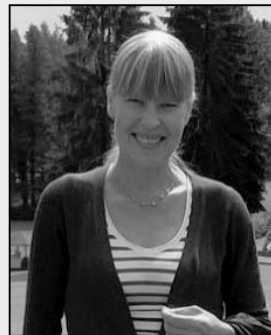
Το Δ.Σ. του συλλόγου μας συλλυπείται θερμά τις οικογένειες των εκλιπόντων.