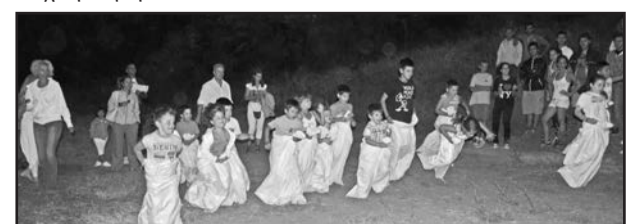
Εικ. 9. Τσουβαλοδρομίες.

Επίσης μάθαμε ότι κάποιο πρόσωπο το προηγούμενο βράδυ διέδιδε πως η επίσκεψη δε θα γίνει γιατί δεν είχε καθαριστεί ο δρόμος. Ελπίζουμε αυτό να έγινε από άγνοια κι όχι κακό-