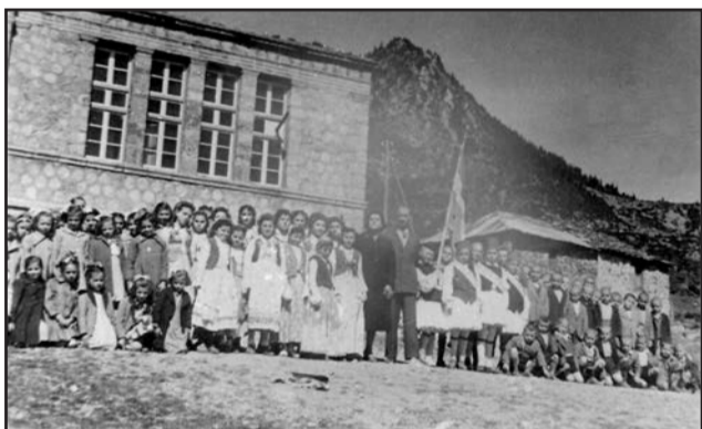
Εικ. 1. Το σχολείο σε γιορτή

Ο δάσκαλος με τη βέργα εξασκούσε καθαριότητα. Έπεσε ξύλο πολύ όπως γινόταν κάθε φορά που είχε καθαριότητα. Λίγοι από τους δασκάλους της εποχής μπορούσαν να καταλάβουν τις συνθήκες που είχαν σαν αποτέλεσμα τη βρομιά. Όταν ο δάσκαλος βαρέθηκε να δέρνει ανακοίνωσε το τέλος της υγειονομικής επιθεώρησης. Τα παιδιά μπήκαν στο σχολείο για το απογευματινό μάθημα.