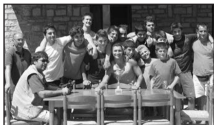
Εικ. 14. Η ομάδα με το κύπελλο στο Κροκύλειο

Σαν τελική αποτίμηση μπορούμε να πούμε ότι οι εκδηλώσεις ήταν πετυχημένες. Αυτό μας λένε πολλά μέλη μας. Εμείς προσθέτουμε ότι ήταν ένα πετυχημένο μείγμα όλων των τύπων εκδηλώσεων που αναφέραμε παραπάνω. Το τωρινό Δ.Σ. του Συλλόγου θα συνεχίσει αυτήν την προσπάθεια μέσα στο οικονομικό περιβάλλον που αλλάζει ραγδαία και καταγιστικά προς το πολύ χειρότερο