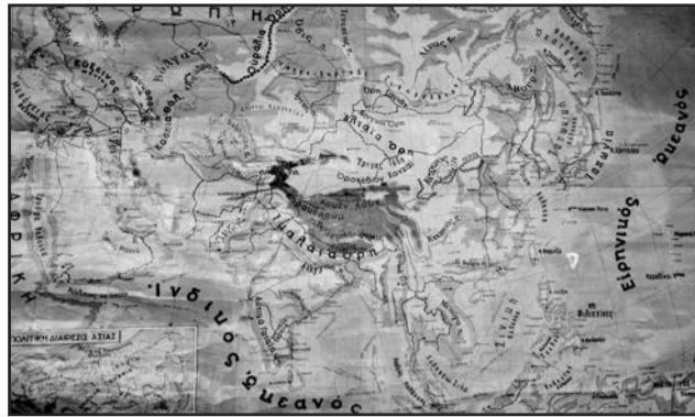
Εικ. 2. Χάρτης της Ασίας.

Μόλις άρχισε η Γεωγραφία ο δάσκαλος σήκωσε τον Κώστα της πέμπτης και το Γιάννη που ήταν μαθητής της έκτης. Συνήθως ο δάσκαλος έβαζε το μαθητή να λέει το μάθημα και μετά έκανε γραφική εργασία χωρίς να προσέχει τα λόγια του μαθητή. Όταν σταμάταγε η μουρμούρα που άκουγε ο δάσκαλος ενώ έγραφε καταλάβαινε ότι ο μαθητής τελείωσε και του 'λεγε να κάσει κάτω. Το ίδιο έκανε με τον Κώστα που εξετάστηκε πρώτος. Μετά ήρθε η σειρά του Γιάννη. Εδώ ο δάσκαλος ρώτησε: «Τι μάθημα έχουμε σήμερα Γιάννη;». «Σήμερα έχουμε για το Δούνα». «Ωραία, πες μας για το Δούνα». Ο Γιάννης άρχισε υπολογίζοντας ότι ο δάσκαλος θα