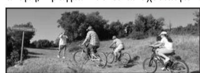
Εικ. 8. Στο δρόμο για την επίσκεψη στα χαλάσματα του πατρικού Μακρυγιάννη

Η μέρα της 13ης Αυγούστου άρχισε με πρωινή επίσκεψη στα χαλάσματα του πατρικού του Μακρυγιάννη στο Αβροίτι. Η συμμετοχή ήταν πολύ μικρή. Είχαμε προγραμματίσει να γίνει η επίσκεψη με ποδήλατα ώστε να εισαχθεί το μέσο αυτό και στο Κροκύλειο. Δυστυχώς το μέλος μας που είχε αναλάβει να το οργανώσει δεν κατάφερε να πάρει άδεια από την εργασία του κι εμείς το μάθαμε πολύ αργά. Παρόλα αυτά ο στόχος επιτεύχθηκε εν μέρει.