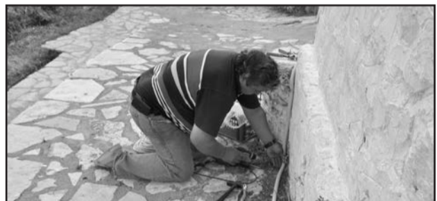
Εικ. 1. Ο επίσημος ηλεκτρολόγος του Συλλόγου επί το έργο.

Είναι Φλεβάρης του 2011 και οι προετοιμασίες για τα Μακρυγιάννεια του καλοκαιριού αρχίζουν να βαραίνουν στις σκέψεις των μελών του Δ.Σ. του Συλλόγου. Αρχίζουμε από τις επαφές για μια μεγάλη συναυλία. Πρέπει να κινηθούμε σύντομα γιατί η ημερομηνία που θέλουμε, 14 Αυγούστου, είναι δύσκολη. Μετά αφού κανονίζεται αυτό πρέπει να δούμε πως θα αντιμετωπιστεί το κόστος. Μετά πρέπει να σχεδιάσουμε τις εκδηλώσεις ώστε το κόστος να μην ξεπερνά τις οικονομικές δυνατότητες του Συλλόγου. Αυτό μπορεί να γίνει με την παραγωγή εκδηλώσεων από το Σύλλογο. Αυτό εξυπηρετεί δύο σκοπούς: Πρώτα