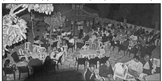
Εικ. 10. Η λαϊκή βραδιά