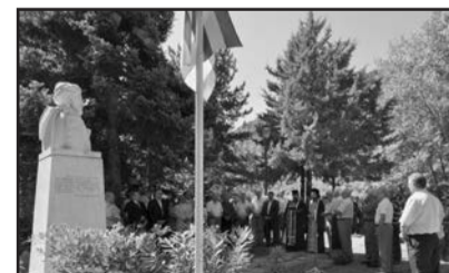
Εικ. 5. Κατάθεση στεφανιών