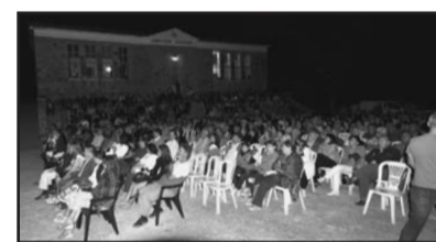
Εικ. 11. Η συναυλία.

ΟΙ ΔΩΡΟΘΕΤΕΣ & ΧΟΡΗΓΟΙ ΤΩΝ ΜΑΚΡΥΓΙΑΝΕΙΩΝ 2011 Για το παζάρι, τη λαχειοφόρο και το Λιβάδι Γεωργίου Γεώργιος & Υιός Ε.Ε. - Πυροσβεστήρες / Θηβών 33, Τ.Κ.185 43, Πειραιάς / Τηλ. 2104206883 & 2104206884 / Προσφορά: 1 πυροσβεστήρας Dimfil Ε.Π.Ε.-Εμπόριο / Κορίνθου 15, Τ.Κ.134 51, Καματερό / Τηλ. 2102323140 / Προσφορά: Βιολογικά προϊόντα ΕΓΝΑΤΙΑ Ε.Π.Ε. - Εμπόριο / Θέση Πάτημα Μάνδρας, εντός ΒΙΠΑ ΒΙΟΠΑ, Τ.Κ.19600, Μάνδρα Αττικής / Τηλ. 2105143437 / Προσφορά: Πλαστικές σακούλες ακουτιδιών & καλαμάκια ΕΛΧΙΣ - Εργαστήριο Κοσμημάτων & Δώρων / Κρατερού 22 & Γρ. Αυξεντίου, Τ.Κ.15771, Ιλίσια / Τηλ. 2107486951 / Προσφορά: Πουγκιά ΕΤΟΥΛΑ - Κινηματογράφος / Ελ. Βενιζέλου 152 (Θησέως), Τ.Κ.17676, Καλλιθέα / Τηλ. 2109510042 / Προσφορά: 5 διπλά εισιτήρια Femme Fatale - Καλλυντικά / Παπανικολή 6, Τ.Κ.18756, Κερατσίνι / Τηλ. 2104615565 / Προσφορά: Καλλυντικά Πιτσαρής Παναγιώτης - Οδοντίατρος / Λ. Παπάγου 27, Τ.Κ.157 71, Ζωγράφου / Τηλ. 2107755542 / Προσφορά: 2 θεραπείες συνολικής αξίας 240€ Χατζηχρυσός Αυγερ. & Βασ. Ε.Π.Ε. - Αυτοκόλλητες ετικέτες / Θέση Κρέσσι, Τ.Κ.32009, Σχηματάρι / Τηλ. 2262056738 / Προσφορά: Αυτοκόλλητες ετικέτες Χυτήρηγλου Ε.Π.Ε. - Λευκά είδη / Πλάτωνος 3, Τ.Κ.17672, Καλλιθέα / Τηλ. 2109563683 / Προσφορά: 2 τραπέζομάντλα Ευχαριστούμε θερμά τους ανωτέρω επαγγελματίες για τις ευγενικές προσφορές τους.