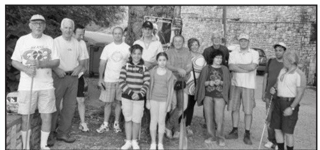
Εικ. 2. Μεγάλη Βρύση. Η ορειβατική ομάδα.

Φτιάχνει τους προβολείς στο σχολείο, τα φώτα στο Λιβάδι. Η