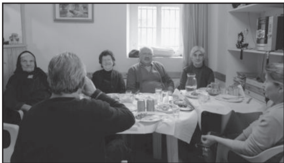
Εικ.1. Αποψη «δεξιά τω εισερχομένω».

Τη Κυριακή στις 14 Μαρτίου ο Σύλλογος έκανε το τραπέζι στους χωριανούς. Το λέμε τραπέζι γερόντων για να το συνδέσουμε με παλαιότερη εκδήλωση του Συλλόγου που όμως γινόταν το καλοκαίρι. Εξ αντικειμένου, αυτή την εποχή του χρόνου, τραπέζι στους χωριανούς και τραπέζι στους γέροντες του χωριού είναι έννοιες σχεδόν ταυτόσημες. Το τραπέζι