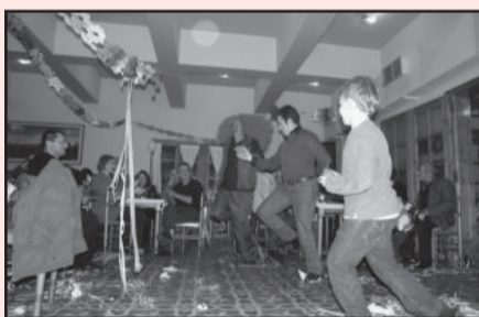
Εικ.3. Ο Αυγέρος και η παρέα συνεχίζουν.