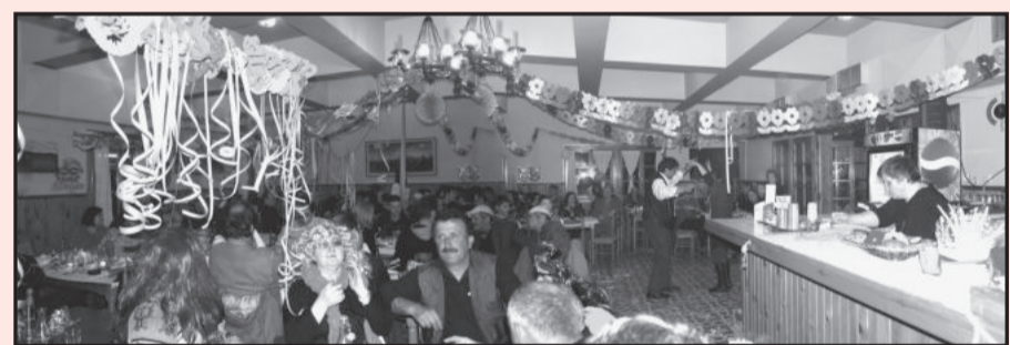
Γενική άποψη της αίθουσας.

Είναι Παρασκευή απόγευμα 12 Φεβρουαρίου και οι συνήθεις ύποπτοι από το Διοικητικό Συμβούλιο του Συλλόγου είναι στη κορυφή στη Παναγία και τακτοποιούν το καταφύγιο. Το Σάββατο έρχεται κόσμος. Ο καιρός βροχερός. Την άλλη μέρα ξημέρωσε με χιόνι. Τα μηχανήματα του Δήμου και του Παράδεισου ξεχύθηκαν προς τα βόρεια. Το