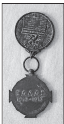
Εικ. 4. Το Διασυμμαχικό Μετάλλιο Νίκης