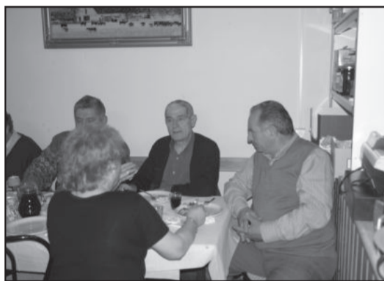
Εικ.3. Παραπέρα άποψη «αριστερά τω εισερχομένω».