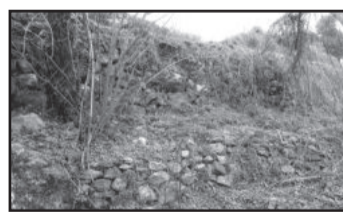
Εικ. 6. Μια από τις μάντρες του Καπετάνιου