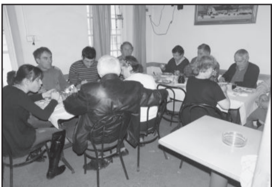
Εικ.2. Πρώτη άποψη «αριστερά τω εισερχομένω».

είκοσι άτομα και περάσαμε δύο ευχάριστες και χορταστικές ώρες. Βοήθησε και ο καιρός. Έξω έριχνε χιόνι κατά διαλείμματα, πράγμα που μας μάζεψε μέσα. Νομίζουμε ότι ήταν χρειαζόμενη εκδήλωση και θα προσπαθήσουμε σκληρά να την επαναλάβουμε του χρόνου.