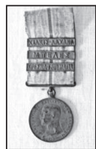
Εικ. 2. Το μετάλλιο μετά «τριών διεμβολιών».