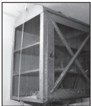
Εικ. 5. «Φανάρι».