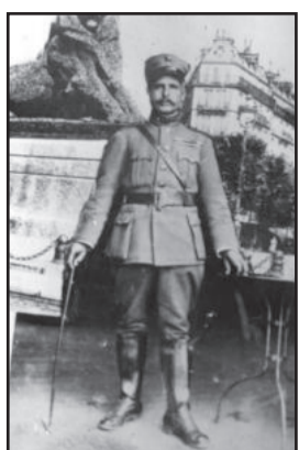
Εικ. 3. Ο Δημήτριος Καραμπέλος στη Σμύρνη.

πεδία των μαχών της Μακεδονίας από 29 Νοεμβρίου 1917 και εντεύθεν. Στις 14 Φεβρουαρίου 1920 προάγεται σε ταγματάρχη «δια διακεκριμένα πράξεις επί του πεδίου της μάχης κατά τις επιχειρήσεις εν Μακεδονία το 1918». Το 1920 μετατίθεται στο 9ο σύνταγμα πεζικού. Το 1921 μετατίθεται στη Σμύρνη και το Μάιο του 1922 στην Αθήνα. Ουσιαστικά δεν έλαβε μέρος στη Μικρασιατική Εκστρατεία. Ίσως το βαρύ τραύμα του 1918 αλλά και η σχετικά προχωρημένη ηλικία του δεν του επέτρεπαν μάχη υπηρεσία. Στις 20 Αυγούστου 1921 του απονέμεται το Διασυμμαχικό Μετάλλιο Νίκης για τη δράση του στο Μακεδονικό Μέτωπο κατά τον Ευρωπαϊκό Πόλεμο.