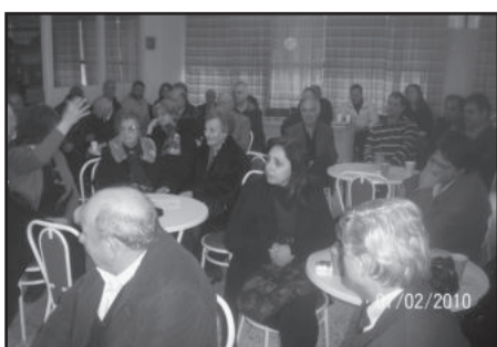
Εικ.1. Άποψη της Γενικής Συνέλευσης.

Στις 7 Φεβρουαρίου 2010 πραγματοποιήθηκε στη στέγη του Συλλόγου η ετήσια Γενική Συνέλευση. Έξω έριχνε γαζέπ' αλλά μέσα η συνέλευση προχώραγε κανονικά. Παραβρέθηκαν πάνω από πενήντα μέλη. Πρώτα, όπως συνηθίζεται, ο πρόεδρος του Διοικητικού Συμβουλίου αναφέρθηκε στις δραστηριότητες του Συλλόγου μέσα στο 2009. Οι δραστηριότητες αυτές έχουν αναφερθεί στην εφημερίδα μας και δεν χρειάζεται να τις αναφέρουμε ξανά. Μετά έγινε ο οικονομικός απολογισμός που εγκρίθηκε. Μετά έγινε ήρεμη συζήτηση μεταξύ των μελών για κάποια παράπονα μέλους του Συλλόγου χωρίς η Συνέλευση να καταλήξει σε ιδιαίτερα συμπεράσματα.