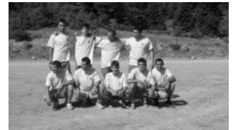
Εικ. 21. Η ποδοσφαιρική μας ομάδα.