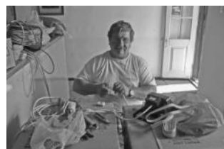
Εικ. 4. Ο επίσημος ηλεκτρολόγος μας επί το έργο.