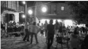
Εικ. 15. Χοροστροβιλισμός με καλαματιανό.