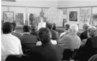
Εικ. 11. Ο Δήμαρχος εκφωνεί λόγο.