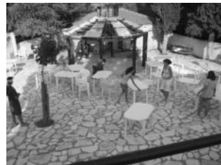
Εικ. 1. Τα κορίτσια στήνουν τα τραπέζια.

ρούς κυρίου τους ξαδέλφους Δημήτρηδες Βασιλείου και Παναγιώτη Ζωγράφου, το Στέλλιο Κορρέ και το Μάνο Παγώνη.