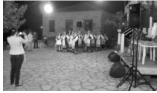
Εικ. 16. Το χορευτικό της Αρτοτίνας αρχίζει δράση.

Το επίσημο πρόγραμμα των Μακρυγιαννέων 2009 τελειώνει εδώ. Όχι όμως και οι εκδηλώσεις. Την Πέμπτη 13 Αυγούστου έγινε το «τάσι» των κυριών του Συλλόγου στη Βιολέτα. Μάλιστα περνώντας από κει κάποιος μύρισε την τσίκα από τα κοντοσουβλία και