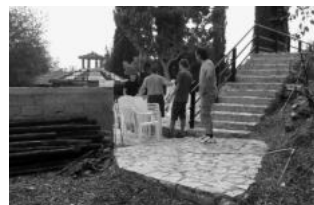
Εικ. 2. Τα αγόρια τακτοποιούν τις καρέκλες.