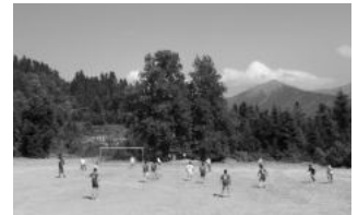
Εικ. 23. Στο γήπεδο της Αρτοτίνας.