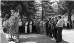
Εικ. 9. Από την εκδήλωση στο μνημείο του Μακρυγιάννη.

Την άλλη μέρα Κυριακή 9 Αυγούστου. Έγινε δοξολογία στο Ναό του Αγίου Γεωργίου και μετά κατάθεση στεφανιών στο μνημείο του ήρωά μας Μακρυγιάννη.