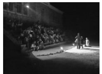
Εικ. 7. Το φιλοθέμιον κοινό παρακολουθεί το θέατρο.