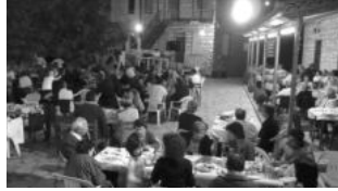
Εικ. 17. Μετά το χορευτικό στη πλατεία.