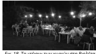
Εικ. 18. Το «τέιον» των κυριών στη Βιολέτα.