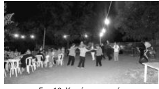
Εικ. 19. Χορός γυναικείος.