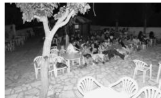
Εικ. 3. Το κοινό παρακολουθεί το έργο.