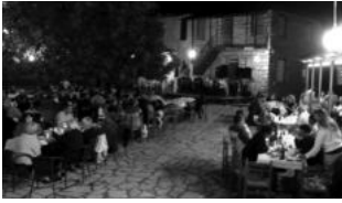
Εικ. 13. Ο κόσμος στη πλατεία έτοιμος για γλέντι. Στο βάθος οι ΕΝ ΠΛΩ.