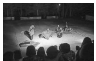
Εικ. 8. Από τη θεατρική παράσταση.