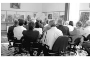
Εικ. 12. Ο πρόεδρος του Συλλόγου εκφωνεί και αυτός το λόγο του.