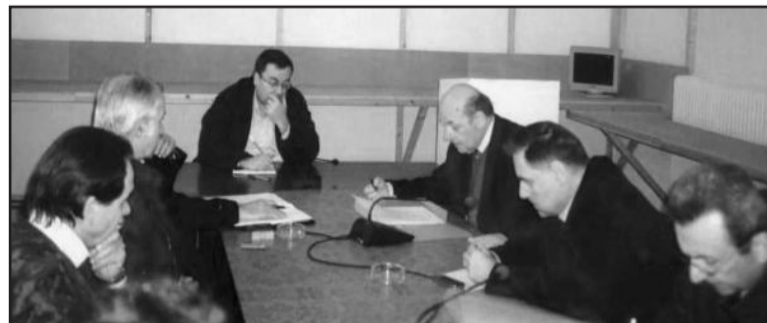
Από την επίσκεψη του Γενικού Γραμματέα της Περιφέρειας