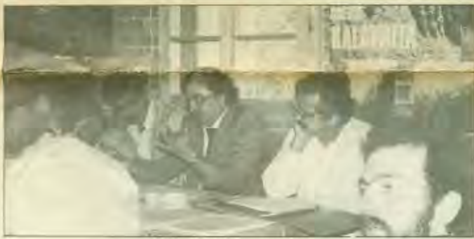
Το Προεδρείο του Συνεδρίου