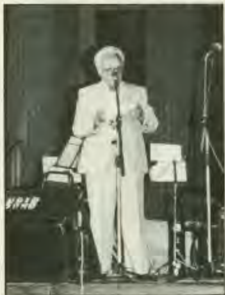
Ο Πρόεδρος του Συλλόγου μας απευθύνει μήνυμα για τη Γαλλική Επανάσταση.