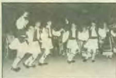
Το χορευτικό μας στην πλατεία του Ζαπτείου