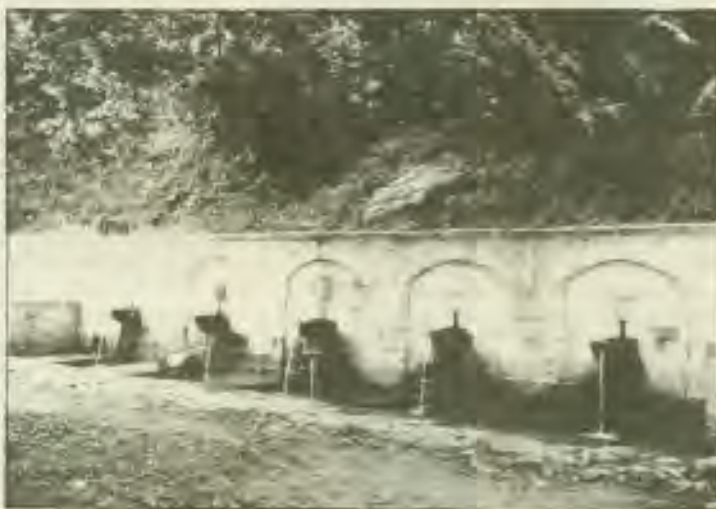
Η «Μεγάλη Βρύση» Κροκύλιου