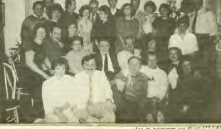
Στη τη συστήση στο Φλίν (22.2.87)